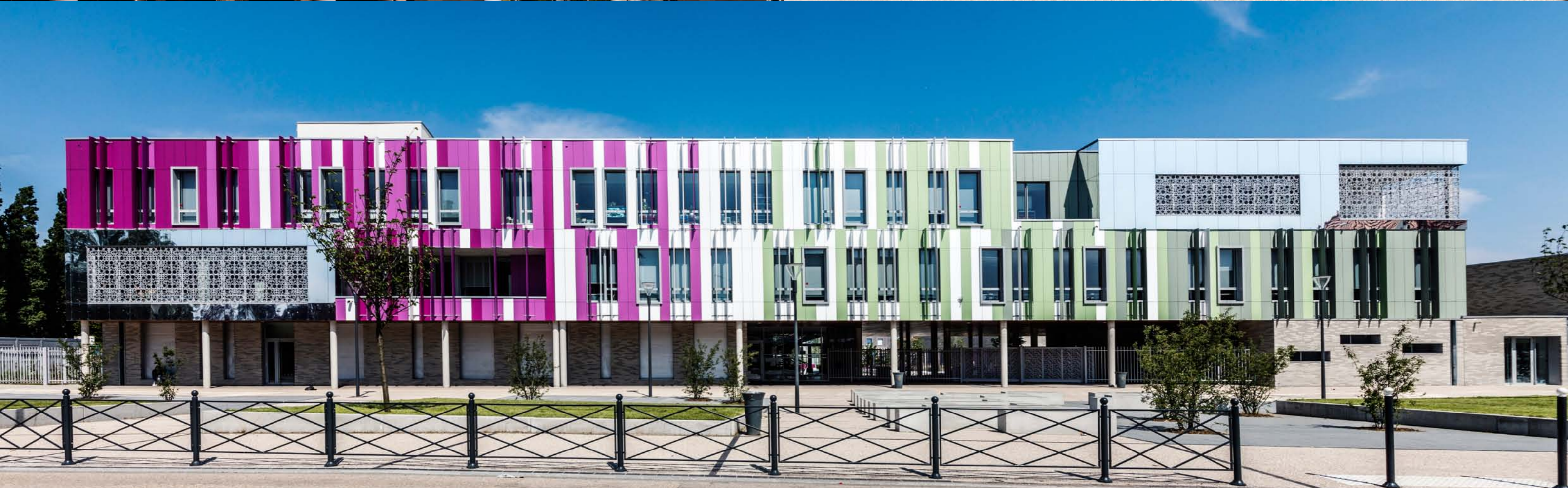
Renson - Collège Desrousseau