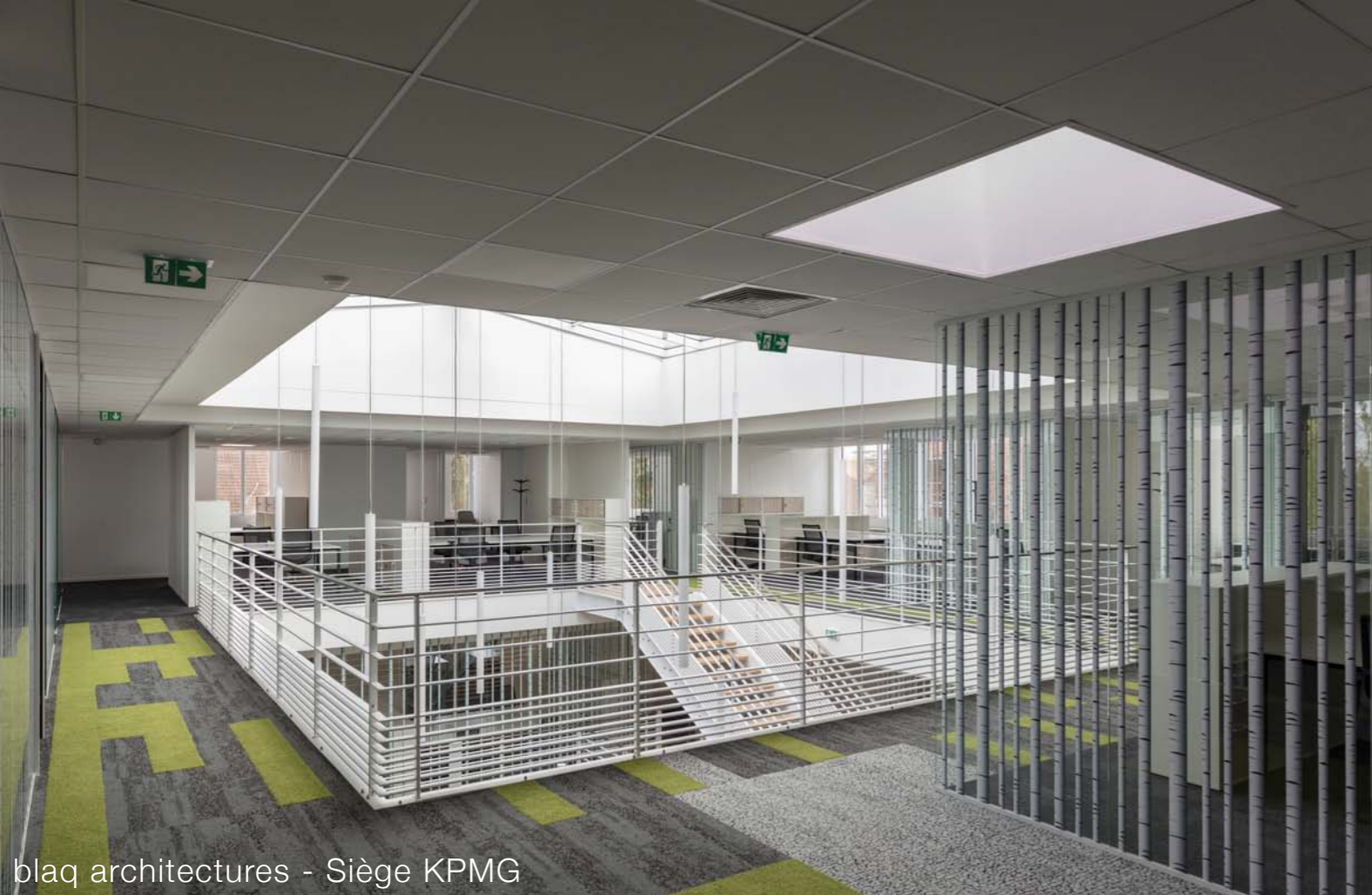
blaq architectures - Siège KPMG