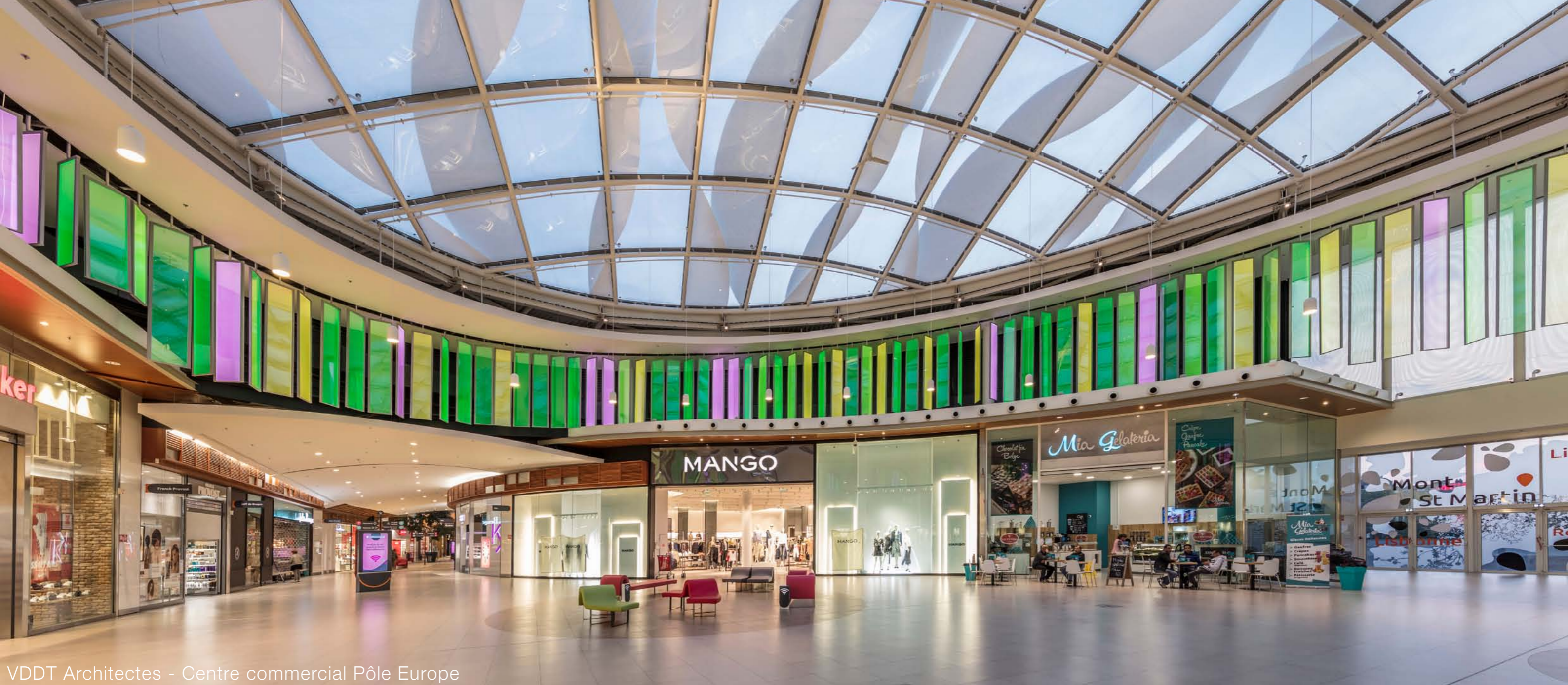
VDDT Architectes - Centre commercial Pôle Europe