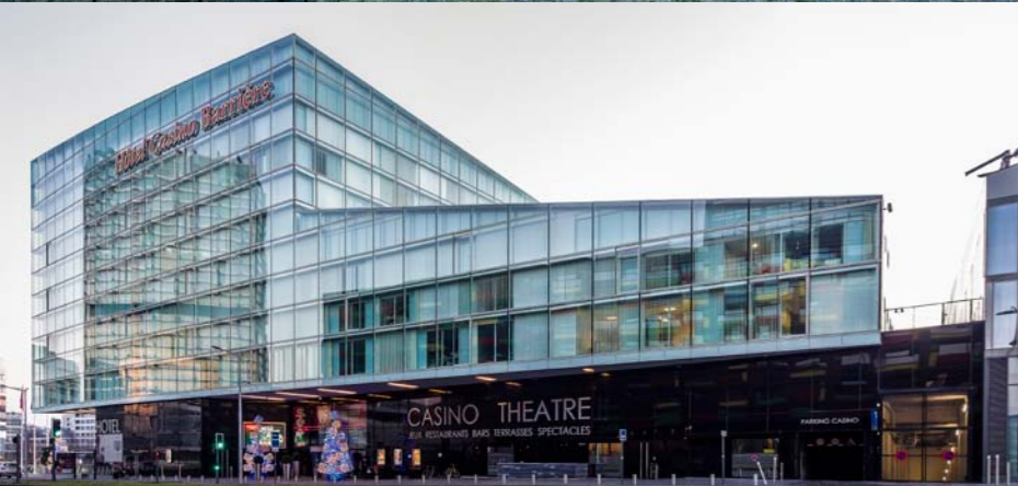
Miralu - Casino Barrière